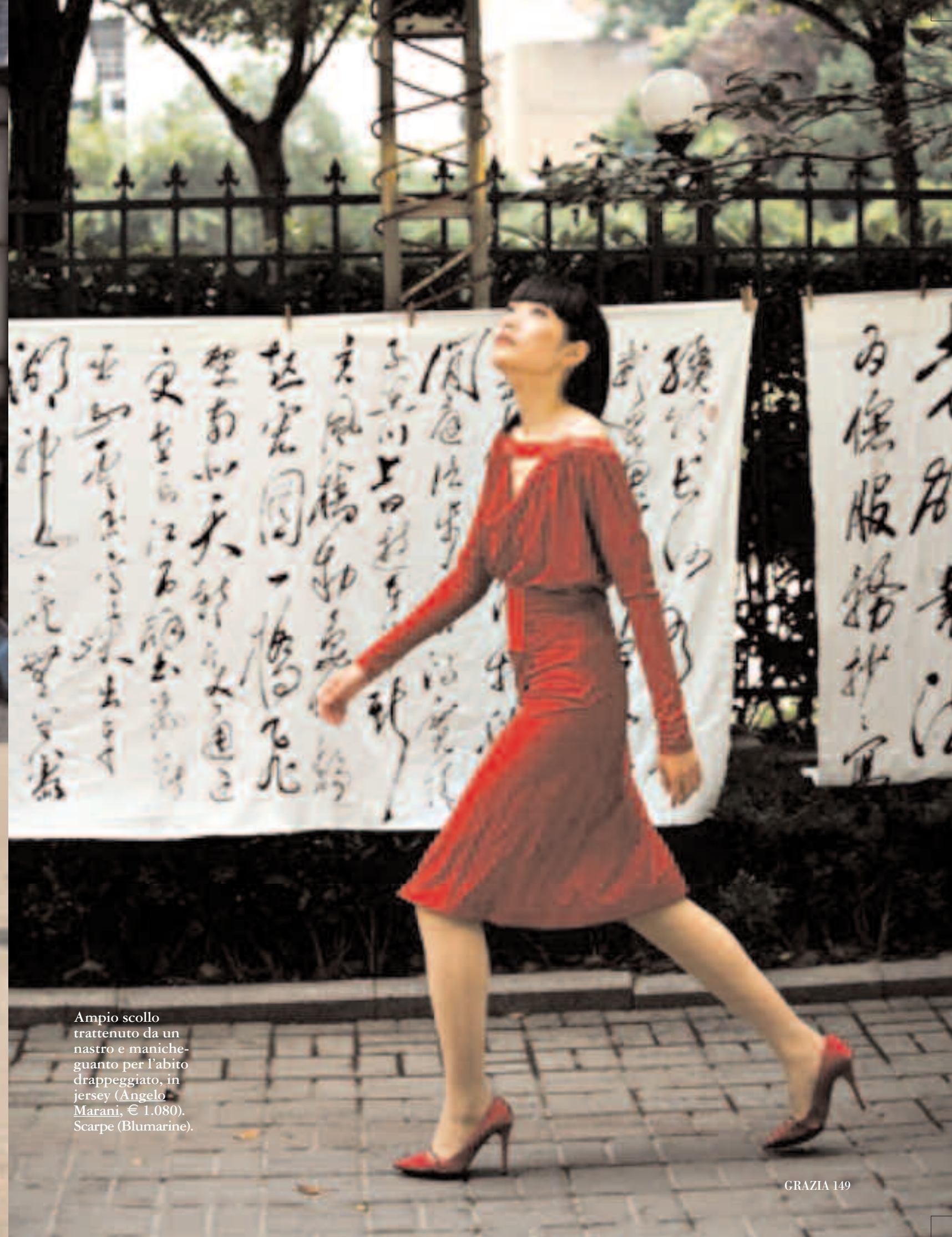
Ampio scollo trattenuto da un nastro e maniche- guanto per l'abito drappeggiato, in jersey (Angelo Marani, € 1.080). Scarpe (Blumarine).