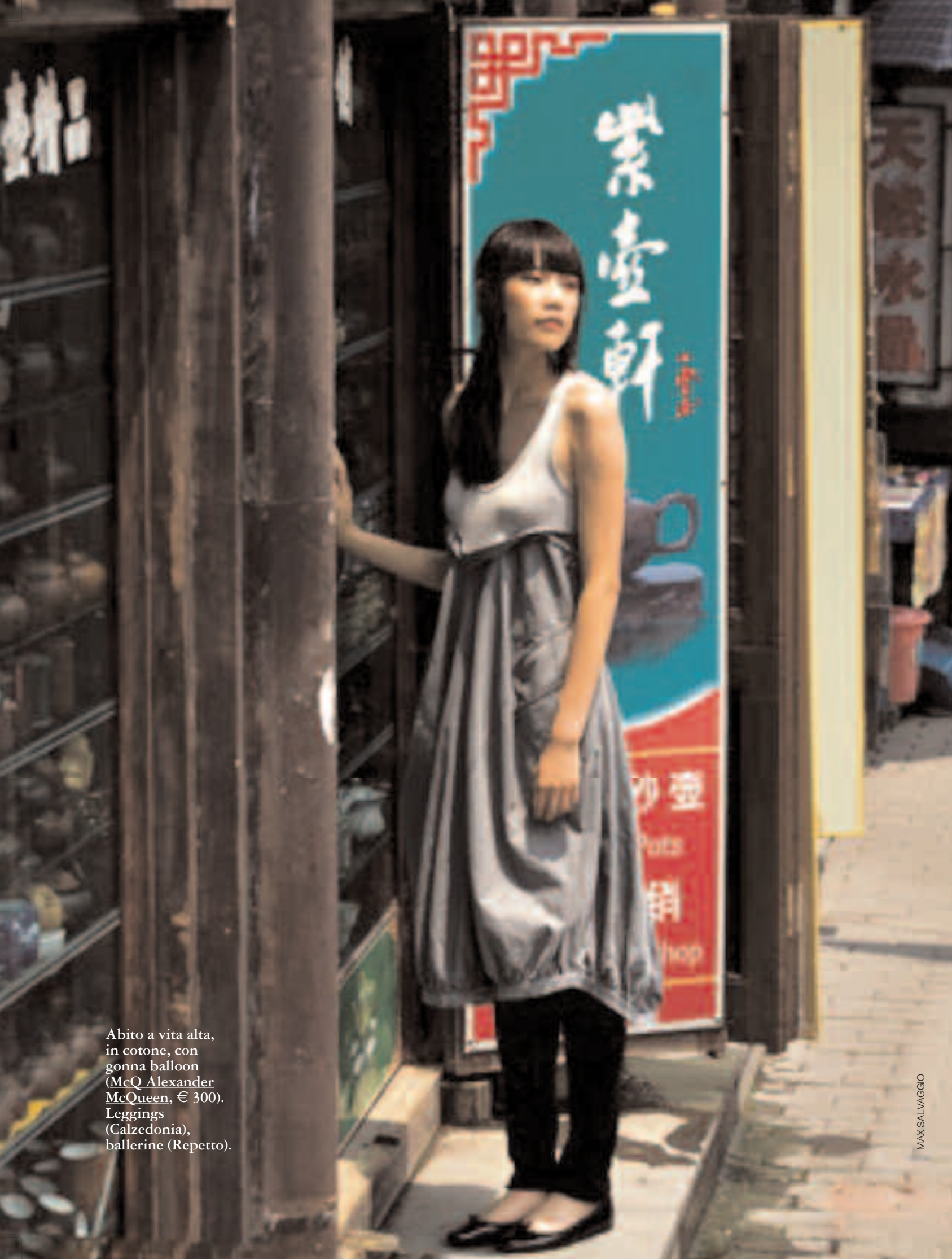
Abito a vita alta, in cotone, con gonna balloon (McQ Alexander McQueen, € 300). Leggings (Calzedonia), ballerine (Repetto).